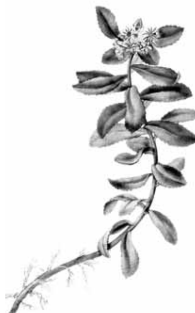
Aizopsis aizoon subsp. aizoon