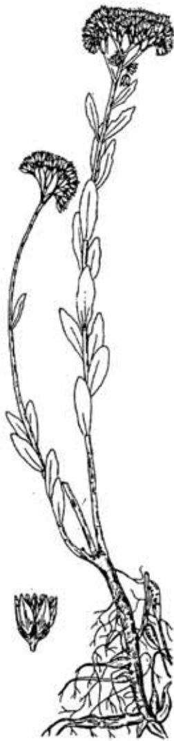
Hylotelephium triphyllum subsp. sukaczewii