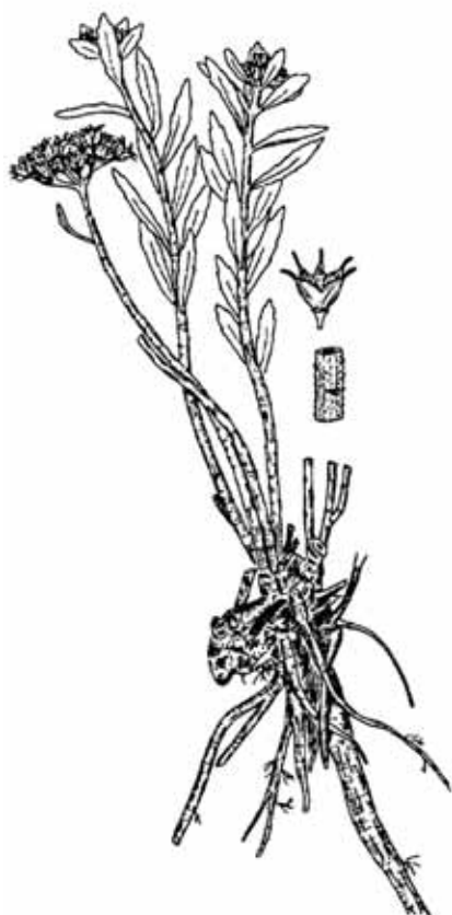
Aizopsis aizoon subsp. baicalensis

числе чашелистиков, золотисто-желтые, остроконечные, с небольшим «капюшоном», широко-ланцетные. Тычинок в два раза больше лепестков, короче лепестков. Пыльники от зеленовато-желтых до почти красных. Завязи сросшиеся. Нектарники почти квадратные. Листовочки звездчато-расходящиеся, деревянистые, сплюснутые с боков. Семена многочисленные, бурые, яйцевидные, с широко-ребристой поверхностью. Весьма полиморфный вид.