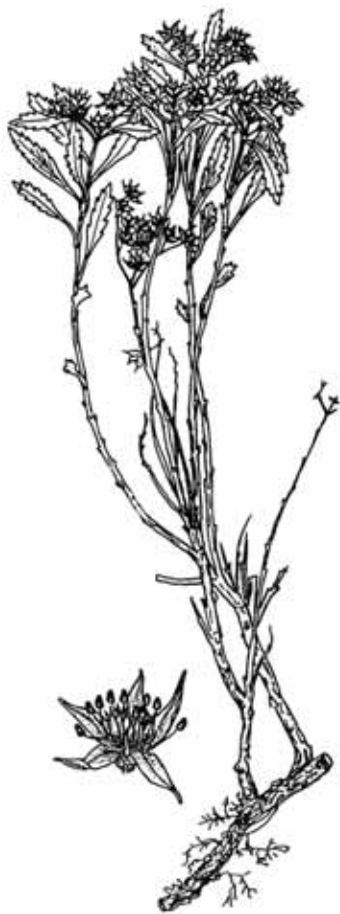
Aizopsis middendorffiana subsp. middendorffiana