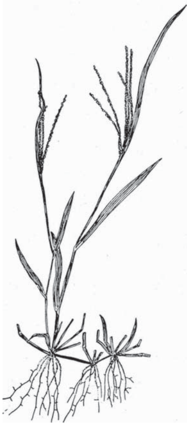
Digitaria asiatica — близкий вид D. ischaemum